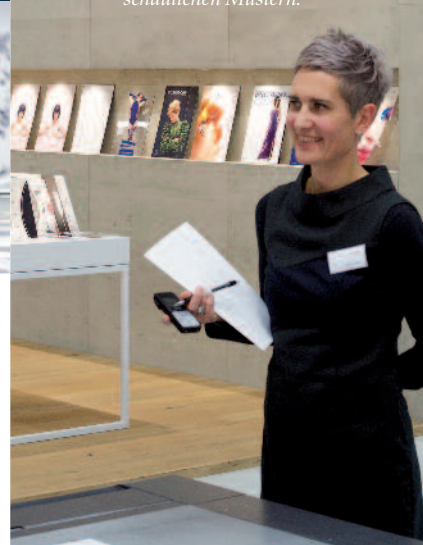
Der neue Standort von swissQprint in Kriessern lässt dem Unternehmen Raum für die weitere Expansion.