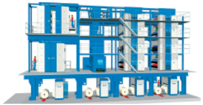
hard Harant (Spartenleiter KBA). So wird die KBA Commander-Anlage bei der Main-Post nach der Erweiterung im Jahr 2008 aussehen. Links die beiden zu einem 16er-Turm für 32 vierfarbige Broadsheet-Seiten aufeinander gesetzten kompakten Commander CT-Achtertürme. Rechts die schon seit Jahren produzierende