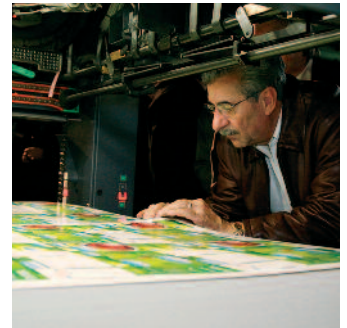
Der mit dem InlineSlitter geteilte Großformatbogen, ideal für die Weiterverarbeitung.

Unabhängig von der Auflagenhöhe sind bei Akzidenzen mit mehr als 48 DIN A4-Seiten die Stückkosten für den Gesamtprozess im Format 7B plus am geringsten.