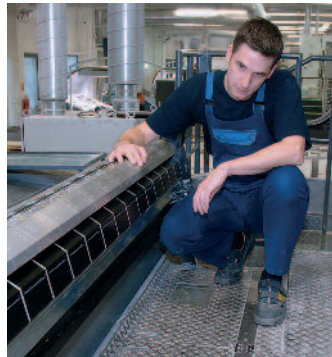
Dichtemessung mit InlineColorPilot macht dem Bogendrucker das Leben leichter.

bis zum Trockner mit der Lieferindustrie abzuklären. In diesem Zusammenhang kündigte Paul Steidle auch einen neuen Trockner an, der deutlich geringere Emissionen freisetzen soll. Zusätzlich werde man, das Automatic Plate Loader (APL)-System auch für den Akzidenzrollenoffsetdruck anbieten. Hycon, ein mechatronisches System, soll die Makulatur nach dem Rollenwechsel und nach dem Auftragswechsel reduzieren. Plattenwechsel bei voller Maschinenlaufgeschwindigkeit verspricht DynaChange und senkt damit die Rüstzeiten.