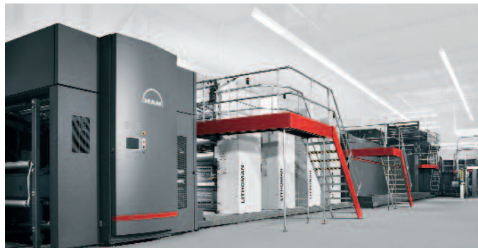
Die 80-Seiten-LITHOMAN: eine neue Leistungsklasse mit einem Ausstoß von bis zu 3,2 Millionen vierfarbigen DIN-A4-Seiten pro Stunde. Die Leistung der Rollenmaschine wird nunmehr mit 96 Seiten noch weiter steigen.

der Plattenwechsel bei 192 Seiten nur noch 2,5 Minuten. Bei einem manuellen Plattenwechsel waren zwei Personen etwa eine halbe Stunde damit beschäftigt. MAN Roland konnte mit dem Chemitzer Verlag und Druck, der Neuen Osnabrücker Zeitung und der Saarbrücker Zeitung bereits drei Kunden für den Plattenwechselroboter gewinnen.