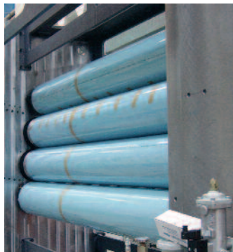
96 Seiten-Lithoman-Plattform: das sind Tiefdruckdimensionen im Offset.

de Perspektiven, so Finkbeiner. Sie würden mit dem gleichzeitigen Schön- und Widerdruck von stark verkürzten Fertigungszeiten und vereinfachten Abläufen in der Produktion profitieren.