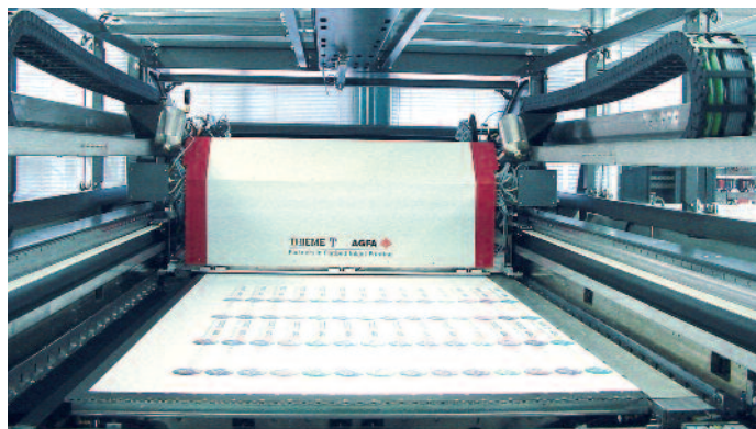
Die M-Press von Agfa symbolisiert den Wandel im Markt: konstruktiv eine Siebdruckmaschine, erfolgt der Druck über digitale Druckköpfe. Die M-Press ist eine Flachbett-Inkjet-Druckmaschine, die auf dem Know-how von Agfa Graphics in den Bereichen Digital Imaging und Inkjet-Technologie sowie der Erfahrung von Thieme bei der Materialhandhabung und im Siebdruck basiert.

tungen. Die 8-Seiten-Modelle des Avalon N verarbeiten Druckplatten bis zum Format von 1.160 x 940 mm und bieten einen Stundendurchsatz von 8 bis 50 Druckplatten. Die VLF-Modelle werden zunächst in drei Varianten – Avalon N16, N24 und N36 – angeboten: mit Plattenformaten von 1.470 mm x 1.154 mm beim N16 über 1.750 mm x 1.400 mm beim N24 bis 2.100 mm x 1.600 mm beim N36. Alle neuen Modelle unterstützen ein internes Registerstanzsystem und werden wahlweise als manuelle Systeme oder mit vollautomatischem Einlegen der Druckplatten mit einer oder mehreren Druckplattenkassetten angeboten. Außerdem verfügen alle Modelle über eine automatische Zwischenblattentfernung, sind kompatibel mit dem Apogee-Workflow-System, den digitalen Thermodruckplatten sowie den entsprechenden Entwicklungsmaschinen von Agfa – einschließlich der chemielosen Druckplatte Azura, der entwicklungsfreien Druckplatte Amigo und der Druckplatte Energy Elite für hohe Druckauflagen ohne Einbrennen. Mit dem N40 und dem N48 sollen im Laufe des Jahres zwei weitere Avalon-N-Modelle für 80-Seiten- und 96-Seiten-Rollendruckmaschinen auf den Markt kommen.