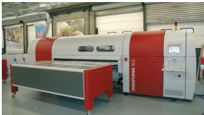
Agfa baut die Anapurna-Familie aus und zeigt auf der drupa drei Modelle des Inkjet Large Format Druckers.

ra-Platte auf und kombiniert das auf einer Gummierung basierende Auswaschen mit einer empfindlicheren Emulsion, wodurch in Thermplattenbelichtern wie der Avalon N-Reihe höherer Durchsatz erzielt werden kann. Die Azura basiert auf der ThermoFuse-Technologie von Agfa, bei der die Druckbilder auf physikalischem Wege ohne jegliche chemische Entwicklung auf den Druckplatten fixiert werden. Ergebnis ist eine extrem stabile und vorhersagbare Qualität der Belichtungen ohne Kompromisse im Druck.