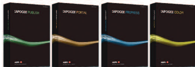
Die Apogee Suite wird als neue umfassende Workflowlösung vorgestellt.

Das Synaps-Material wird nach einem patentierten Formulierungs- und Produktionsverfahren hergestellt. Es werden Hohlräume im Polyestersubstrat erzeugt, was dieses weiß und opak macht. Das Material ist auf beiden Seiten mit einer speziellen Farbaufnahmeschicht beschichtet, die nicht nur eine sehr gute Bedruckbarkeit, sondern dem Material außerdem das besondere Aussehen verleiht und die Haptik eines Luxuspapiers bietet.