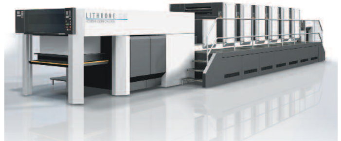
Das Flaggschiff: Die Lihtrone LS 40, eine 3b-Maschine, wird in einer LX-Version auf den Markt kommen.

Im Sinne weiterer Optimierung hat Heidelberg seine gesamte Speedmaster-Reihe einer Verjüngungskur unterzogen und bringt zur drupa die neuen Baureihen Speedmaster SM 52 und SM 74. Zudem setzt die neue Speedmaster XL 75 mit einer Geschwindigkeit bis zu 18.000 Bogen/h neue Leistungsmaßstäbe in der Formatklasse 50 cm x 70 cm. Mit bis zu zehn Druckwerken und Wendung lässt sich eine SM 52 ausstatten und senkt mit dem Anicolor-Kurzfarbwerk die Anlaufmakulatur auf 20 Bögen. Die Heidelberg Anicolor-Technologie wird aber vorerst nicht über die SM 52 hinausgehen. Nach den Worten von Heidelberg-Technik-Vorstand Dr. Jürgen Rautert sei es wichtiger, den Wunsch nach stabil laufenden Sonderfarben zu realisieren, als bereits in diesem Stadium