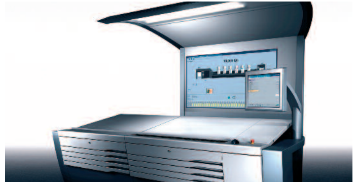
Mit der prozessorientierten Bedienungsführung »Intellistart« lassen sich die Schritte beim Umrüsten einer Speedmaster um bis zu 70% senken.

nen (Maschine, Farbe, Papier) abgestimmt und optimiert die jeweiligen Daten selbstständig im laufenden Druckprozess. Makulatur und Rüstzeiten können so reduziert werden. Mit dem gleichen Ziel erweitert MAN Roland sein Angebot an Inline-Regelungen und Steuerungen. Der Process-Pilot soll beim Einhalten der Produktionsstandards helfen, der Inline-Color-Pilot dient der Farbmesung in der Maschine ohne Druckbogen ziehen zu müssen. Ein weiteres Tool ist die OK-Balance, mit der eine stabilere Qualität über die gesamte Auflage erreicht werden soll.