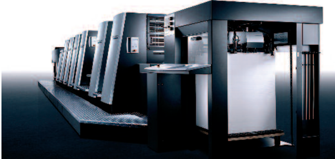
Besonderes Augenmerk legt Heidelberg auf die Entwicklung und den Ausbau der XL-Baureihe. Das erfolgreiche Konzept der Speedmaster XL 105 hält jetzt mit der XL 75 auch Einzug in der Formatklasse 50 cm x 70 cm.