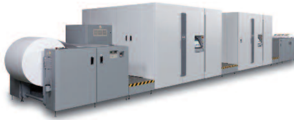
Als zweite Rollenplattform zeigt Canon auf der drupa die Océ ImageStream 2400.