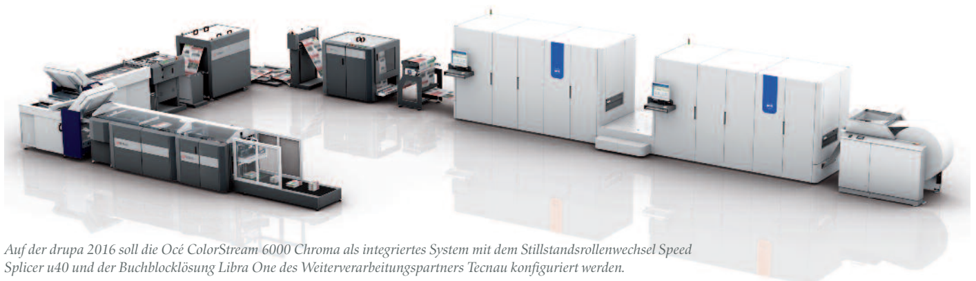
Auf der drupa 2016 soll die Océ ColorStream 6000 Chroma als integriertes System mit dem Stillstandsrollenwechsel Speed Splicer u40 und der Buchblocklösung Libra One des Weiterverarbeitungspartners Tecnaul konfiguriert werden.