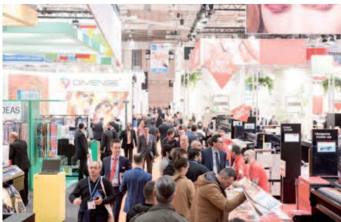
Die Mehrzahl der 20.456 Besucher der Fespa 2017 und ihrer Parallelveranstaltungen, die vom 8. bis 12. Mai in den Messehallen Hamburg stattgefunden haben, blie-