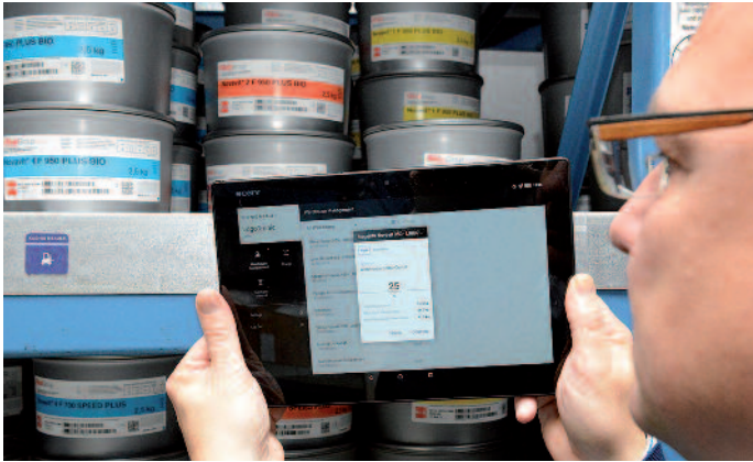
Lagerplatz mit NFC-Tag: Lagerort und Farbmenge werden im Lager mit der ProductionApp erfasst und stehen für die Weiterverfolgung bereit.

Smartphones eingebaute NFC-Funktion. Damit wird die Datenerfassung einfach und sicher.