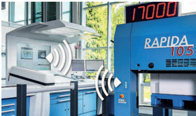
Mit ErgoTronic AutoRun konfigurieren sich Rapida-Bogenoffsetmaschinen selbst, wechseln vollautomatisch die Jobs und produzieren diese ohne manuelle Eingriffe der Bediener.

Für mehr Transparenz auch im Lager hat Koenig & Bauer die Production-App und damit eine Lager- und Chargenverfolgung für mobile Geräte entwickelt. Herzstück ist die in vielen