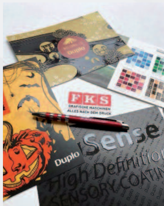
Ein anschauliches Druckprodukt, das für Aufmerksamkeit sorgt, bedarf einer produktiven und wertsteigernden Druckweiterverarbeitung.

Unterstützt wird dies dadurch, dass den Kunden der Zugang zu Druckprodukten via Online-Shop deutlich erleichtert wird. Und zweitens, indem den Kunden heute Veredelungsmöglichkeiten angeboten werden können, die dank moderner und zum Teil digitaler Techniken so schnell und preiswert sind wie nie zuvor. Einige dieser Techniken werden natürlich auch rund um die Tage der Medienproduktion auf der PRINT digital! CONVENTION präsentiert. Einen ersten Vorgeschmack bietet unsere Ausgaben ›Druckmarkt‹ 113, die im März erschienen ist, und die ›Druckmarkt impressions‹ 123, die aktuell im Internet abrufbar ist.