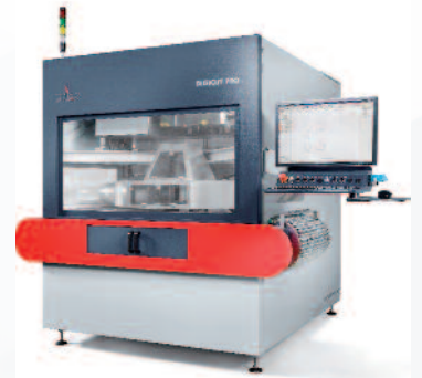
Polar bietet Lasersysteme für das Schneiden, Perforieren und Gravieren und das Veredeln von unterschiedlichen Materialien.

Diese Technik ermöglicht gegenüber einem XY-Gerät eine vielfach höhere Bearbeitungsgeschwindigkeit und macht die Veredelung auch von größeren Auflagen wirtschaftlich. Die Laserbearbeitung erfolgt bei diesen Geräten on-the-fly, das heißt, der Bogen wird auf einem kontinuierlich laufenden Transportband durch den Arbeitsbereich des Lasers befördert, wodurch das Material in der Länge nicht beschränkt ist. Die maximale Bogenbreite des Digidcut Plus beträgt 30 cm, die des Digidcut Pro 50 cm.