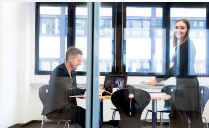
Doch trotz aller Technik: Ohne Menschen und eine vertrauensvolle Kundenberatung geht auch in dem automatisiertesten Business nichts.

nen Technologie-Umfeld unterwegs. Deshalb verbinden wir die unterschiedlichsten Technologien zu einem sinnvollen Großen und Ganzen«, konstatiert Schneider.