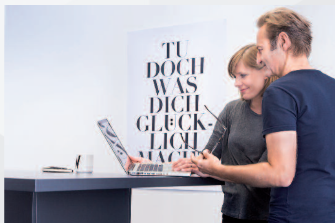
Rund 100 Mitarbeiter arbeiten in München bei w&co für Kunden aus Industrie, Handel und Verlagen.

Damit schloss sich der Kreis: w&co war wieder beim Bild und bildgebenden Arbeiten angelangt. Allerdings ist von Scannern & Co., die einstmals zum Kerngeschäft gehörten, heute weit und breit nichts mehr zu sehen. Stattdessen Rechner und Monitore so weit das Auge reicht. Das schon