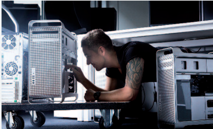
Technologie und effiziente Workflows mit hohen Automatisierungskomponenten spielen bei w&co seit jeher eine herausragende Rolle