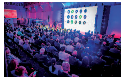
Volles Haus: An drei Veranstaltungstagen verfolgten 640 Druckfachleute aus fast 40 Ländern die Präsentation einer vernetzten Druckfabrik.