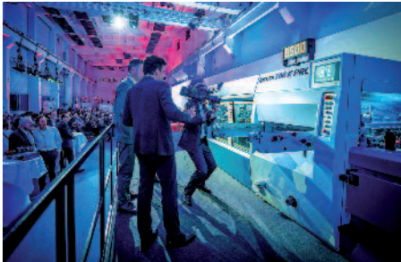
Weltneuheit und erstmals in Radebeul zu sehen: die Flachbettstanze Ipress 106 K Pro von KBA-Iberica verfügt über den gleichen Anleger wie Rapida-Bogenoffsetmaschinen und Leistungen, die anderen Stanzen in nichts nachstehen.