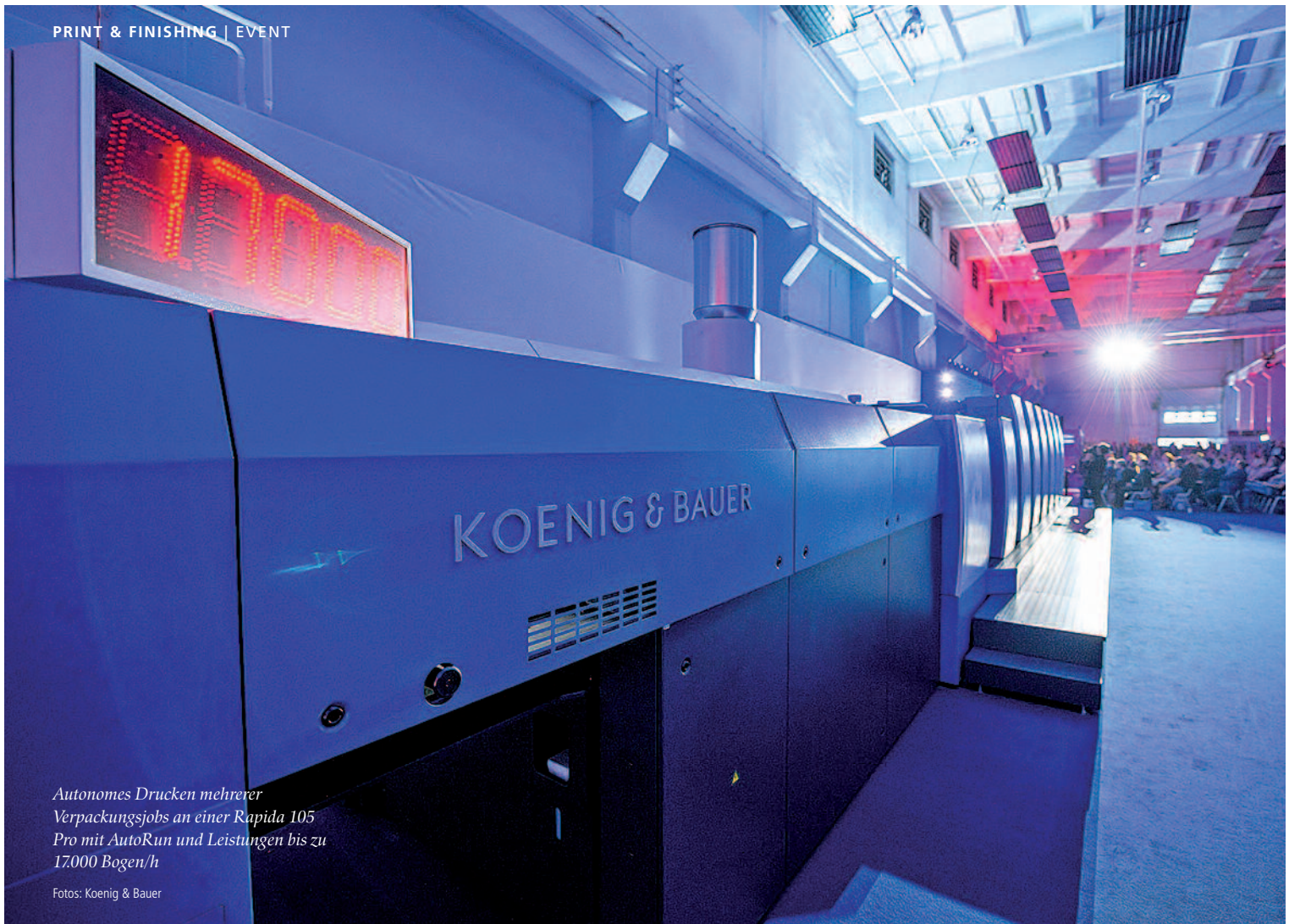
Autonomes Drucken mehrerer Verpackungsjobs an einer Rapida 105 Pro mit AutoRun und Leistungen bis zu 17000 Bogen/h