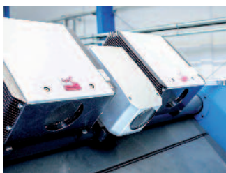
Zwei Kameras inspizieren die Druckbogen bis zur maximalen Maschinenleistung. Sie erkennen kleinste Differenzen im Vergleich zur Referenz, die anhand des Vorstufen-PDFs erstellt wurde.