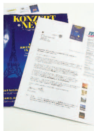
Im Mittelpunkt aller Printaktionen von MünchenMusik steht das Magazin KonzertNews . Die Personalisierung der Begleitschreiben von KonzertNews läuft auf einem Inkjet-Bogendrucksystem.

druckt und versendet Goebel+Lenze bis zu neun Mal pro Jahr personalisierte Postkarten, Mailings mit Flyern und einmal pro Quartal die KonzertNews .