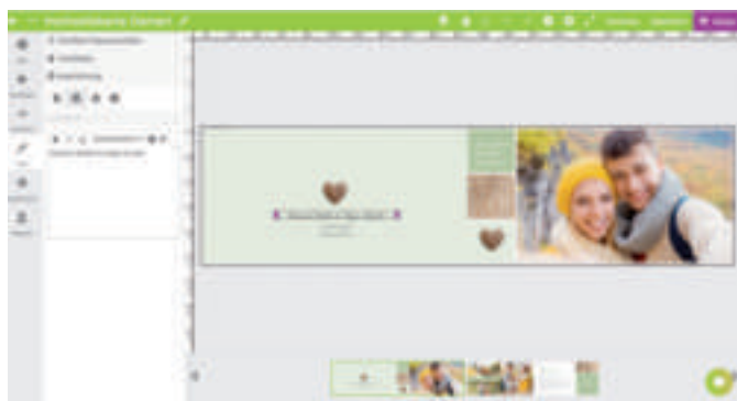
Obility hat den Designer Pro für das kartenmacher.ch-Portal exakt mit den Funktionen ausgestattet, die für die individuelle Grußkarten-Gestaltung erforderlich sind. Dank seiner Flexibilität ist das Web-to-Print-Werkzeug von Obility vielseitig einsetzbar.