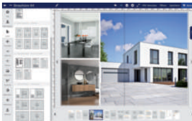
Beim Layout jeder einzelnen Seite haben die Makler dank des Web-to-Print-Editors Designer Pro von Obility die Wahl zwischen mehreren verschiedenen Varianten.