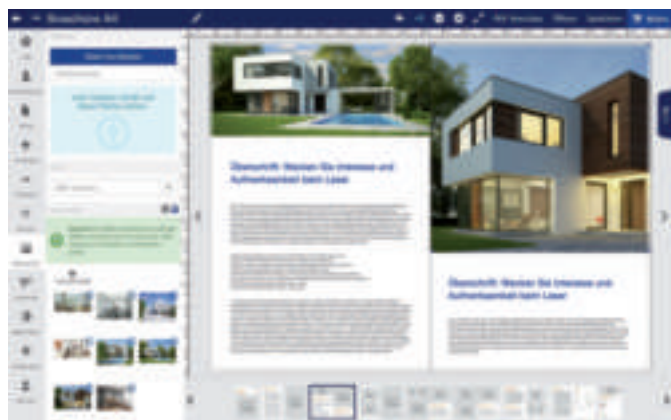
Die Bacher Immarketing -Portale bieten Maklern vielfältige Möglichkeiten der Gestaltung der einzelnen Seiten ihrer Exposés mit Bildern.

Doch nicht immer werden die Exposés gedruckt. Häufig bestellen die Nutzer der Portale nur PDF-Dateien. Zum Beispiel wenn sie unterwegs sind und ungeplant Kunden besuchen wollen. Die Bacher Immarketing -Portale sind responsive. Die Makler können Dokumente also jederzeit auch mit mobilen Kommunikationsgeräten gestalten und downloaden. Beispielsweise im Pkw. Auf den Portalen werden von allen Broschüren automatisch E-Books generiert. Diese stehen den Maklern in Form von PDF-Dateien für den Download und zum Beispiel für den Versand per E-Mail an Interessenten zur Verfügung. Über ihre Exposés hinaus generieren die Nutzer auf den Portalen auch ihre Anzeigen und Profilbilder, die sie in Tageszeitungen