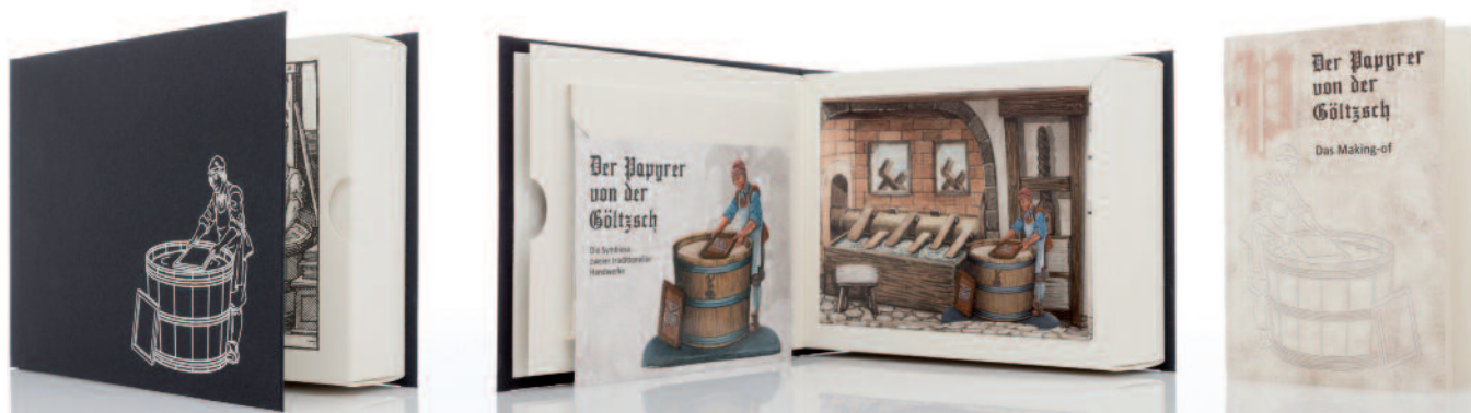
Das Kooperationsprojekt ›Papyrer von der Göltzsch‹ stellt zwei alte Handwerkskünste in den Fokus: Die Herstellung von Papier und das Zinn gießen. Die Box zeigt eindrucksvoll, dass sich Nachhaltigkeit und hochwertige Verpackung für Luxusartikel kombinieren lassen.