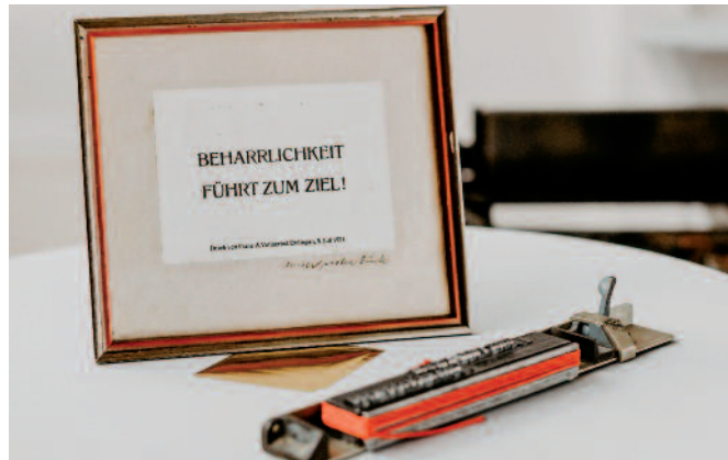
Der Leitsatz »Beharrlichkeit führt zum Ziel« wird bei Vollherbst seit Generationen gelebt.