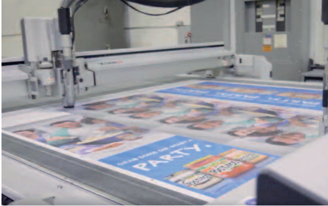
NSG produziert auf modernster Produktionstechnik, darunter drei Zünd D3 Cutter und ein S3, im Großformat eine Vielzahl an Werbematerialien für den POS.

erstellen. Mit fixen Stundensätzen pro Job kann ich aber einen sauberen Wochenplan erstellen und kann ihn dynamisch anpassen, falls der Produktionsablauf das erfordert. Damit bin ich in der Lage, flexibel auf Unvorhergesehenes zu reagieren und den Workflow ›on the flow‹ zu halten.« Ohnehin ist SORRENTINO ein »großer Verfechter transparenter Prozesse«, wie er es ausdrückt. So kann grundsätzlich jeder im Unternehmen auf Zünd Connect zugreifen und die Leistungsdaten der angebundenen Cutter einsehen – natürlich auch die Bediener. »Wenn sie die Produktionsleistung ihres Cutters kennen, möchten sie auch herausfinden, wo sie Verbesserungen vornehmen können.«