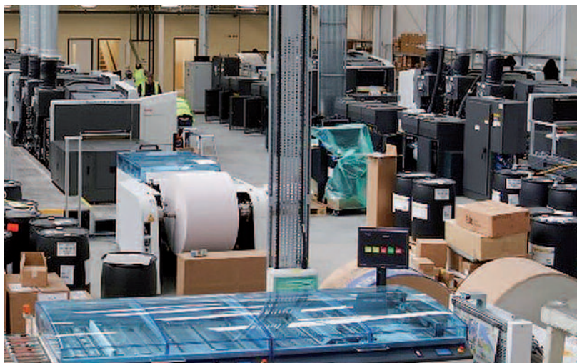
Die im Vereinigten Königreich erscheinenden Zeitungen der Verlage News UK, The Daily Mail Group und Reach sowie die Lokalzeitung Jersey Evening Post werden auf Jersey mit zwei Kodak Prosper 6000P gedruckt. Der Vertrag wurde gerade verlängert.

KP Services in Saint Saviour, Jersey, ein Gemeinschaftsunternehmen von Kodak und der Guiton Group, wird nach der Vertragsverlängerung bis Mai 2024 mehr als 20 verschiedene Zeitungstitel für den Vertrieb auf Jersey und Guernsey drucken.