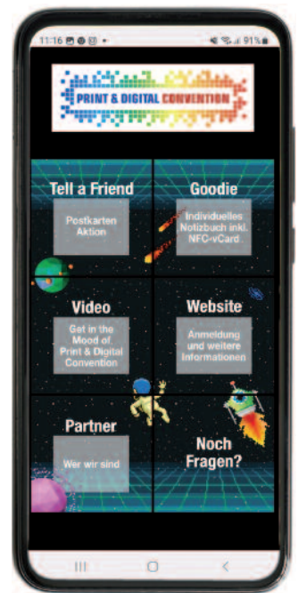
Das angesprochene personalisierte Einladungs mailing mit NFC-Sticker auf dem Beileger (unten). Von dort gelangt man via Scan des NFC-Tags auf eine persönliche URL. Auch die Übersichtsseite der Print & Digital Convention ist mit NFC-URL umgesetzt: Scant man den NFC-Sticker im Kreuzmailing, gelangt man zu den relevanten Inhalten.

Generell bietet eine NFC-URL die optimierte Verlinkung zu vom Unternehmen gewünschten Inhalten: per Smartphone-Scan eines NFC-Tags oder QR-Codes.