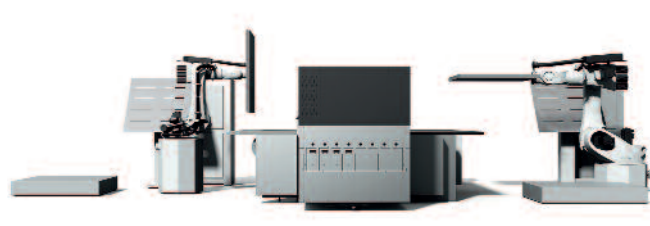
Im Zentrum von P5 Robotics steht das P5 350 HS D4 Hybrid-Drucksystem, dessen Feeder-/Stackereinheit zwei Kuka -Roboter bilden, um die mannlose Produktion einer