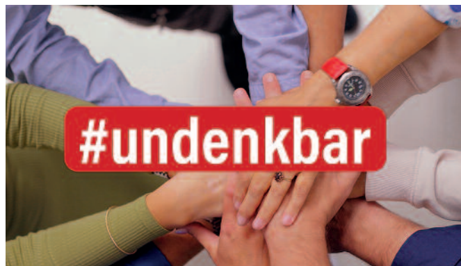
Hier klären zipcon consulting und die Initiative Online Print (IOP) mit ihrem Video auf: https://www.youtube.com/watch?v=i4WmBseqY9Q

Denn IT, Cloud & Co. sind für 5% bis 9% des Stromverbrauchs verantwortlich, was 2% der weltweiten CO 2 -Emissionen ent-