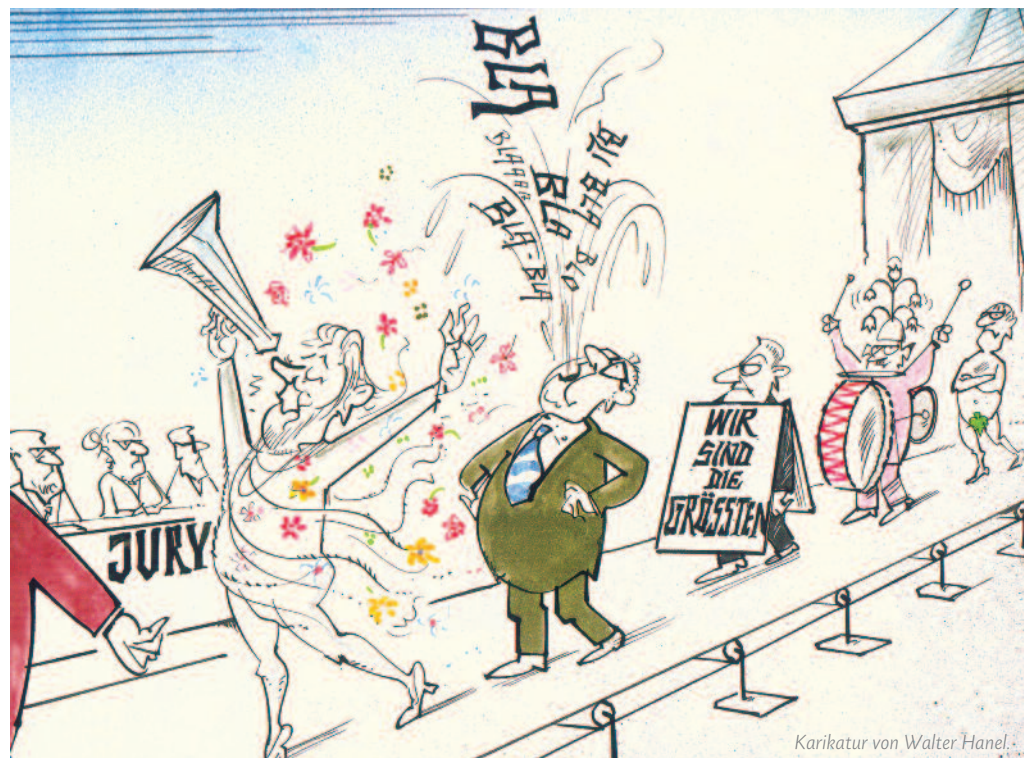
Karikatur von Walter Hanel.

Von einem offenen Wettbewerb profitieren letztlich alle Marktteilnehmer – allen voran die Kunden, die sich in wenigen Tagen einen kompletten Überblick verschaffen, Lösungen für ihren spezifischen Bedarf suchen sowie Angebote im direkten Gespräch diskutieren und vergleichen können.