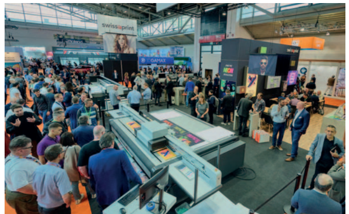
Fespa Global Print Expo, European Sign Expo und Personalisation Experience (6. bis 9. Mai 2025, Messe Berlin) werden über 550 neue und wiederkehrende Aussteller aus mehr als 36 Ländern begrüßen und damit bereits die Ausstellerzahlen der letztjährigen Veranstaltungen übertreffen.