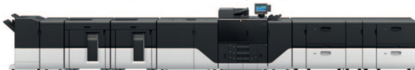
TA Pro 15050 – modulares Inkjet-Drucksystem für den hochqualitativen Massendruck.