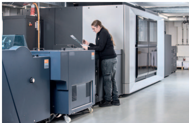
Die Schmid-Fehr AG setzt bei der digitalen Weiterverarbeitung von auf der Jetfire 50 produzierten Druckaufträgen auf die Lösungen des Heidelberg Technologiepartners C.P. Bourg.

vativen Geist zeugt auch die Investition in die Inkjet-Bogenmaschine Jetfire 50.