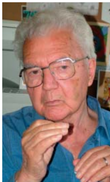
Für Adrian Frutiger ist die Vergangenheit wesentlicher Bestandteil der Gegenwart: »Alles Gegenwärtige ist auf der Erfahrung der Vergangenheit aufgebaut.«

Somit ist für Adrian Frutiger die Vergangenheit wesentlicher Bestandteil unserer Gegenwart. Nun ist es seine Absicht, uns sein Vermächtnis in Form eines Buches zu überlassen. Weil es auch seine Intension ist, Din-