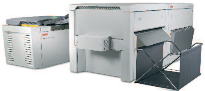
Der Kodak Magnus 800 soll künftig durch eine Reihe XLF-Systeme ergänzt werden.

Aufgrund des Wachstums im Großformatmarkt und der Zunahme von Druckmaschinen mit Formaten von 80 und mehr Seiten, kündigte Kodak für die Einführung eines XLF-Plattenbelichters als Mitglied der Magnus Plattenbelichterserie an. Der Magnus XLF 80 Quantum unterstützt extrem große Formate bis zu 80 Seiten und basiert auf dem Magnus VLF. Der Magnus XLF 80 bietet alle Leistungsmerkmale und Eigenschaften, die für Großformatdruckereien von Bedeutung sind, darunter