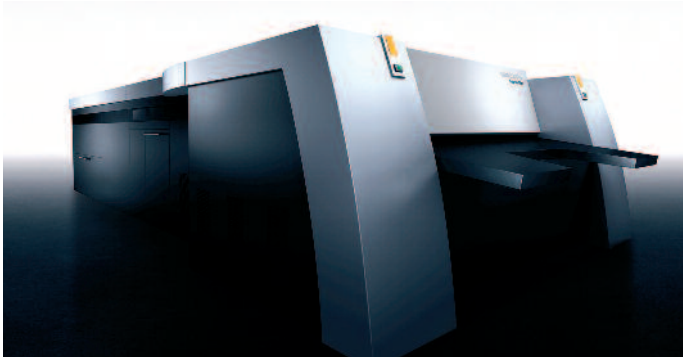
Optisch an den Anleger der neuen großen Bogenmaschinen angepasst: die neuen CtP-Systeme von Heidelberg.