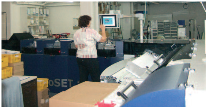
Ein Teil der autoSET 18 in Aktion. Die Konfiguration ist einfach über das Touch-Panel zu bedienen. Bei einem Auftragswechsel laufen fast alle