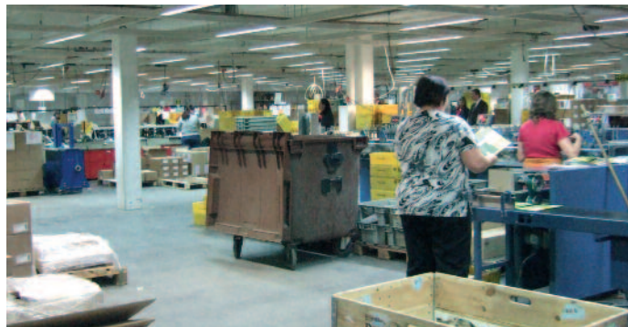
Einstellungen automatisch ab. Trotz hoher Automatisierung gibt es bei LS Dialogmarketing viel Handarbeit.

auf die Qualität aus dem Hause LS. Die Auflagen liegen zwischen 1.000 und einigen Millionen. Produziert wird vor Ort in Dettingen mit etwa 300 Mitarbeitern auf einer Fläche von 30.000 m 2 .