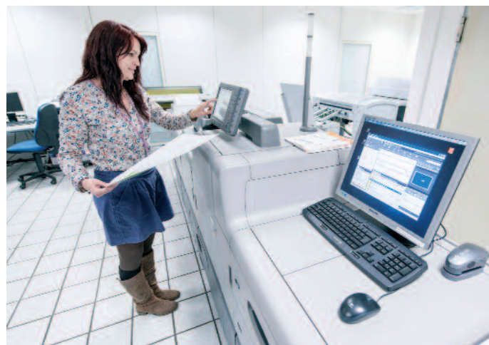
Mit dem Digitaldrucksystem Linoprint C 751 produziert drucken 123 kleinste Auflagen und auch Hybridprodukte, bei denen ein Teil im Offsetdruck und ein Teil im Digitaldruck hergestellt wird. 20% bis 30% der Aufträge sind bereits Kombinationen aus Digital- und Offsetdruck.

Um noch flexibler zu produzieren, installierte drucken 123 im letzten Herbst ein Digitaldrucksystem Linoprint C 751 und weitere damit sein Geschäft aus. »Auf der Anlage produzieren wir Auflagen, die kleiner als 200 sind, wirtschaftlicher als im Offsetdruck«, erklärt Müller. Gedruckt werden personalisierte Einladungen, Flyer oder Mailings. Dabei hat der Anteil der Hybridprodukte, also Drucksachen, bei denen ein Teil im Offset und ein Teil im Digitaldruck hergestellt werden, bereits auf 20% bis 30% zugenommen.