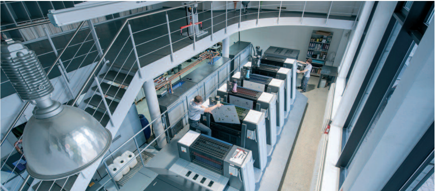
Bei Reuffurth wurden innerhalb weniger Monate bereits über 1,3 Millionen Bogen produziert – bei einer durchschnittlichen Auflagenhöhe von 2.000 Bogen.