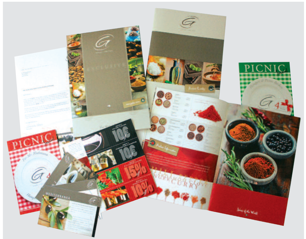
Die Drucksachen des fiktiven Versandhändlers Gustav auf einen Blick: Mappe, Hauptkatalog, Aktions- und VIP-Broschüren, Gutscheine und Einladungskarten sowie der Briefbogen.