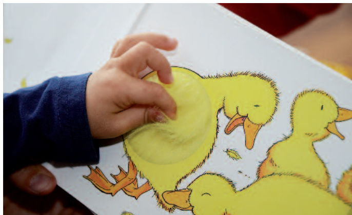
Fühlbücher lassen Kleinkinder einen Begriff im wahrsten Sinn des Worts »begreifen« oder »erfassen«.

Um unterschiedliche Medienkanäle zu vernetzen, etabliert sich mit Augmented Reality (AR) eine vielversprechende Technologie. Internationale Konzerne wie das Möbelhaus Ikea oder der Automobilhersteller Audi setzen AR bereits geschickt ein und liefern darüber hinaus spannende und nützliche Informationen. Bei Ikea lässt sich durch die Kombination aus gedrucktem Katalog und einer App beispielsweise ein Sofa auf virtuellem Weg in das Wohnzimmer holen und man kann sich ansehen, wie sich das Möbelstück in den Raum einfügt. Für den Möbelkonzern ist AR ein weiteres Tool, um den Kunden optimal auf den Besuch eines seiner 350 Einrichtungshäuser vorzubereiten.