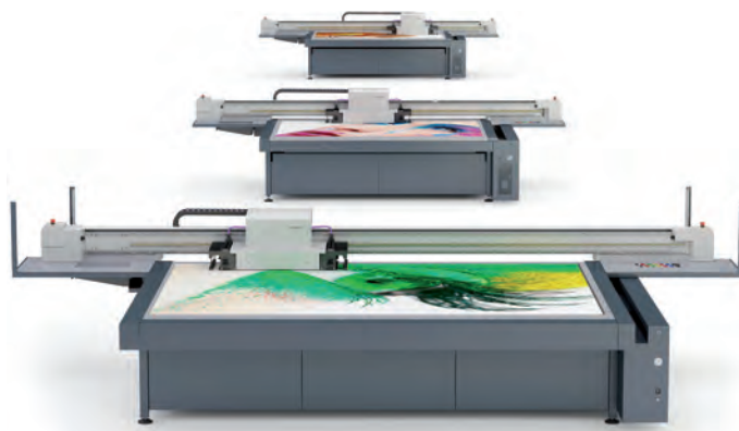
Die Druckermodelle von swissQprint: im Vordergrund die neue Nyla2 mit größerem Druckbereich, dahinter die Modelle Impala und Oryx.