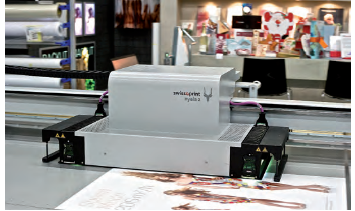
Dabei gibt es kaum einen Bedruckstoff, der via UV-Inkjet-Druck nicht bedruckt werden könnte. Im Hintergrund die umfangreiche Mustersammlung im Showroom in Widnau.

stärke von 5 cm bieten die swissQprint-Drucker einen ausreichenden Spielraum.