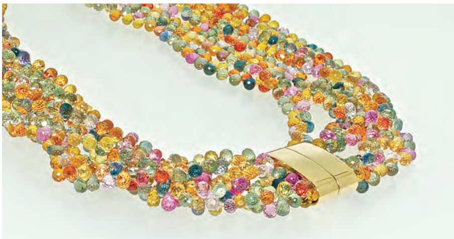
COLLIER | VERSCHLUSS: ROSÉGOLD 750ER. STEINE: SAPHIR IN ALLEN FARBEN. DESIGN BY BARBARA HAUSER