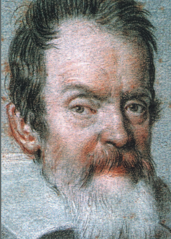
Galileo Galilei, Abschwörer.